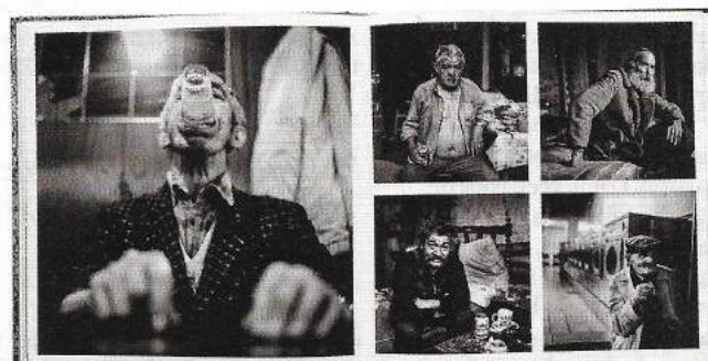
Een kantelmoment voor het Vlaamse fotoboek.