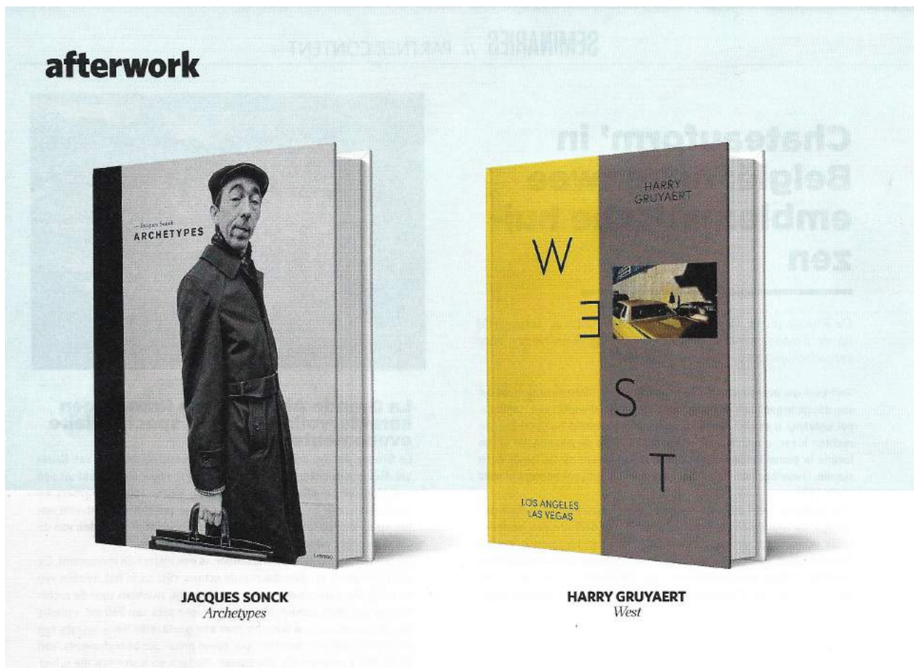
JACQUES SONCK Archetypes

Een foto is een boek by Wim Ver Elst in Trends on March 14th 2019, p. 106-9