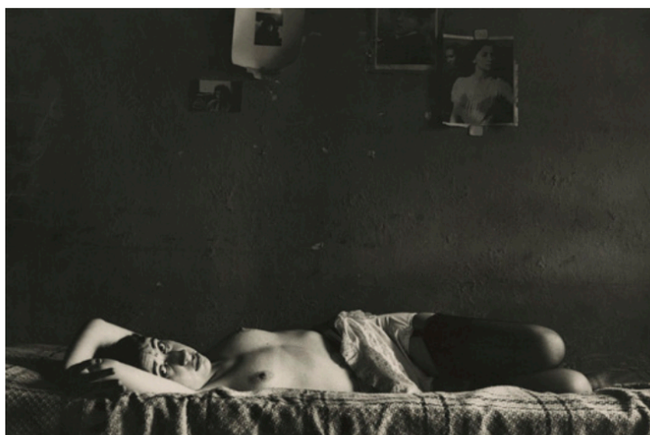
INEZ, C. 1947