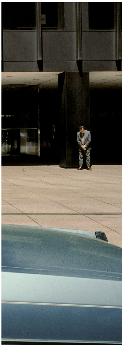
Harry Gruyaert, It's not about cars