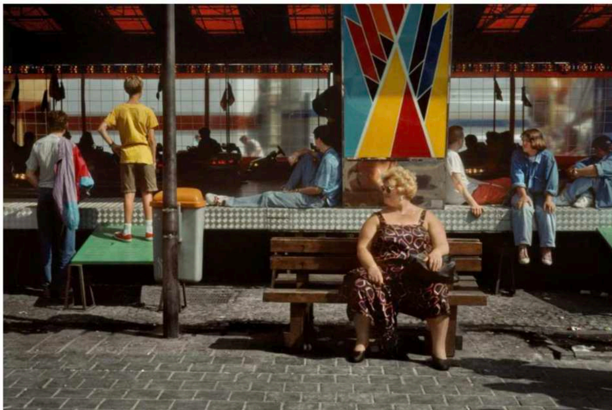
Beeld van een kermis.

In die beginperiode fotografeerde Gruyaert veel kermissen, braderieën, processies en carnavalstoeten, waarbij het onderscheid tussen die twee laatste niet altijd heel duidelijk te maken valt. Je ziet een hond uit het raam kijken naar een groepje als katten verklede deelnemers aan de Ieperse Kattenstoet; of een groepje toeschouwers die geamuseerd toekijken hoe het hoofd van Johannes de Doper op een schotel wordt meedragen in de Heilig Bloedprocessie in Brugge. Het zijn beelden waaruit gevoel voor humor spreekt. Gruyaert is daarbij niet zozeer geïnteresseerd in wat er in die stoeten of processies zelf te zien is, maar in de mensen die op de stoep staan toe te kijken. Die trottoirscènes hebben iets intiems alledaags. Tegelijk zijn ze bijzonder, omdat Gruyaert telkens wacht om af te drukken tot er iets onverwachts gebeurt. Hij is in eerste instantie een straatfotograaf. Hij zoekt mensen niet op in de intimiteit van hun huis, want dan ontstaat sociaal contact, en dat wil hij vermijden. Gruyaert gaat liever als een gawwdief te werk, voortdurend op de loer om het juiste beeld te treffen, op zoek naar de essentie van een plek op een bepaald moment.