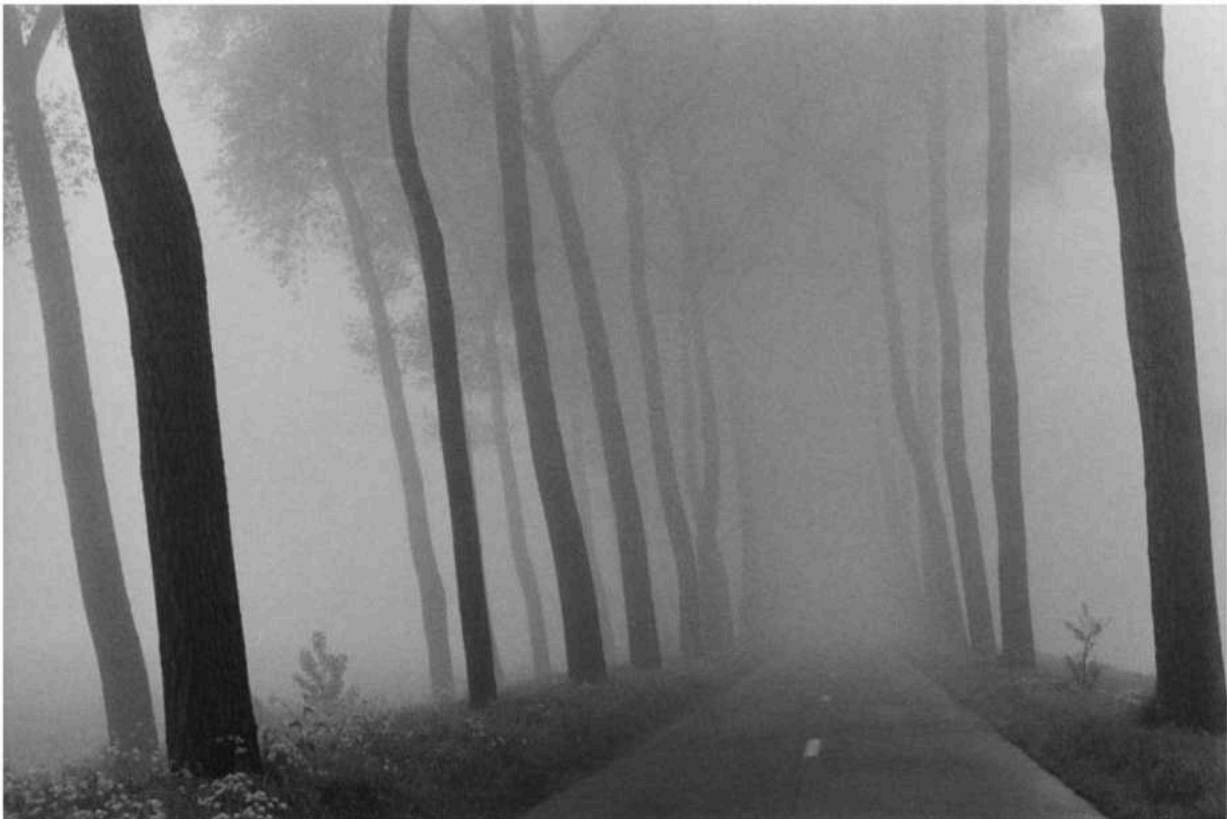
De weg van Brugge naar Damme.

Een minder opvallend aspect van zijn sensualiteit is zijn fascinatie voor texturen, merkt Matthieussent in het voorwoord op. Dat klopt, en je ziet het inderdaad pas bij nader toezien: de suède jas van een vrouw, in een groen dat een echo krijgt in de stengels van de bloemenruiker waar ze net voorbijloopt; de glanzende huid van een dalmatiër, gefotografeerd door een raam; de wuivende rode veren op de grenadiersmutsen van een regiment dat meedoet aan een re-enactment van de Slag bij Waterloo. Gruyaert is een heel tactiel fotograaf.