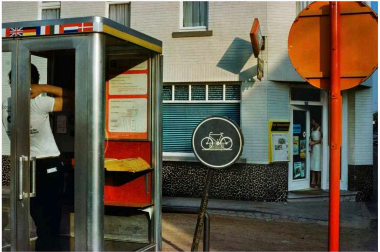
Provincie Brabant, 1981.