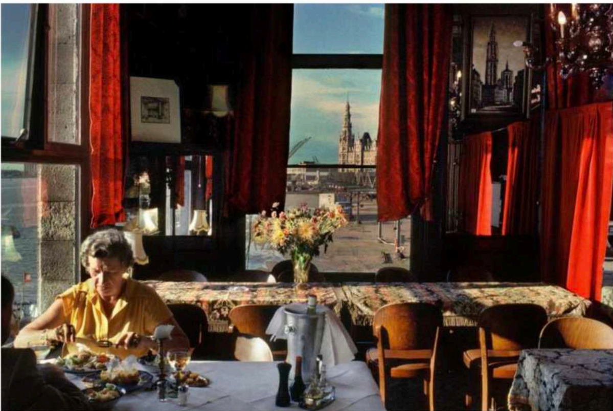
Antwerpen, 1992.

Vanaf de jaren 90 duiken geregeld foto's op die voller en complexer zijn. Je zoekt naar de centrale focus van het beeld, maar de vele details nodigen je oog uit om rond te dwalen en op zoek te gaan naar reflecties, herhalingen, nuances: in een Antwerps interieur zit onderaan links een vrouw te eten. Door het raam is een toren te zien, die een echo vindt in een afbeelding van de kathedraal in een lijst aan de muur. Een spiegel reflecteert een deel van het interieur dat buiten beeld is, en op een druk bebloemd tafelkleed staat een vaas met bloemen in dezelfde tinten. Het binnenvallende zonlicht op de vele rode gordijnen geven het beeld een grote intensiteit. Het is een foto waarnaar je kunt blijven kijken. En het is een echo van de manier waarop Bruegel – nog een van Gruyaerts favoriete schilders – verschillende scènes in één beeld samenbracht.