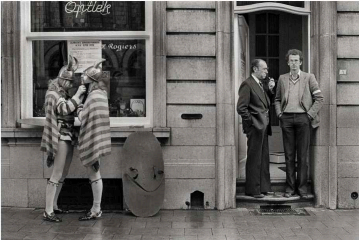
Kattenstoet, Ieper.