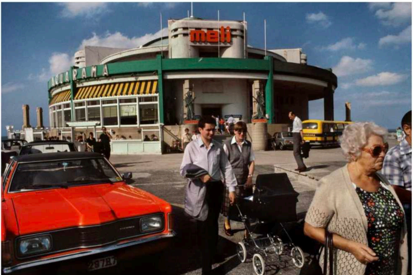
Blankenberge, 1988.

De expo 'Homeland' loopt tot 26 oktober in Gallery Fifty One, Antwerpen. In de aangrenzende Gallery Fifty One Too is een selectie te zien uit 'TV-shots: Olympics 1972'. Het boek 'Homeland' is uitgegeven bij Atelier Exb en is opnieuw verkrijgbaar vanaf 17 oktober.